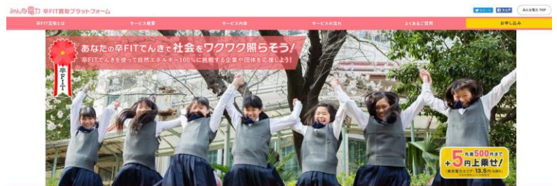
「顔の見える PtoP 卒 FIT プラン」

本サービスへのお申込みは専用ウェブサイト ( https://minden.co.jp/afterfit/ )にて開始しております。さらに、住宅用太陽光を多く手がける京セラ株式会社と協力し、卒FITを迎える多くのお客さまへ周知してまいります。