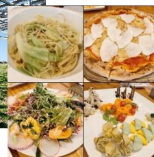
ソーラーシェアリングと農園見学 千葉県匝瑳市 2019年11月30日(日)