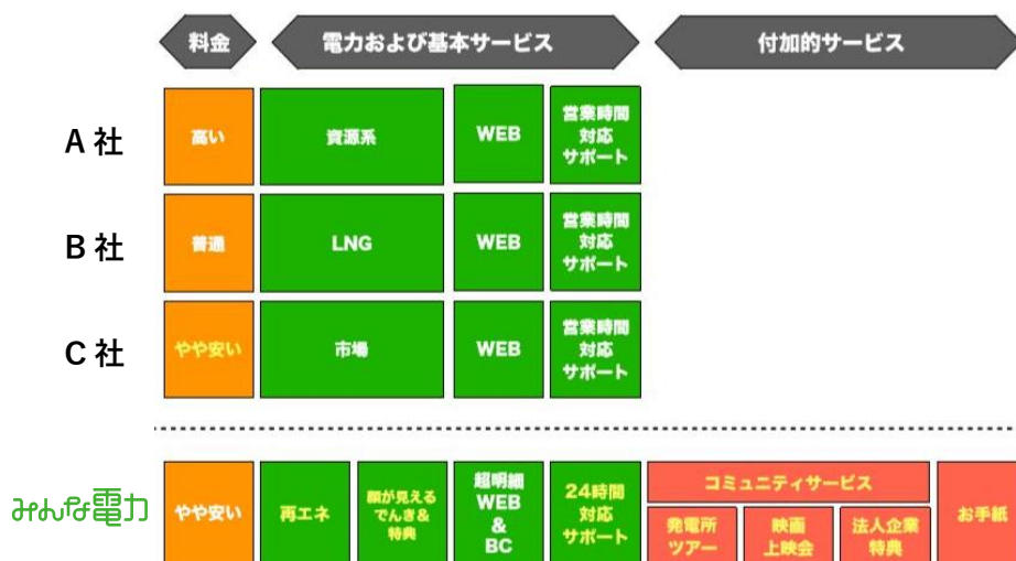
みんな電力 サービス比較 イメージ図