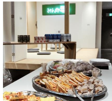
三軒茶屋オフィスにて気候変動をテーマとした映画の試写会と交流会 2019年11月22日(金)

このようなサービスを他電力会社と比較すると、下の図のようになります。 みんな電力は今後もお客さまに納得して電気代を支払っていただけるよう、「最安値」よりも「コスパ最強」を目指して、圧倒的に「顔の見える電力」サービスの拡充を行ってまいります。