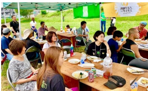
磯沼ファーム見学とバーベキュー 東京都八王子市 2019年6月2日(日)

電力の生産地を訪れ、そこに携わる人々との交流を通して、電気の大切さやその土地ならではの食、観光資源などを理解いただく機会となります。