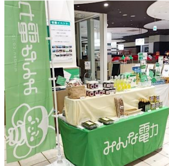
「電気と食の物産展～下北半島編～」 マルイファミリー溝口 2019年9月19日(木)～9月25日(水)

「顔の見える電力」をご利用いただいている法人、個人のお客様同士が繋がることで、企業のサステナビリティへの取り組みや“顔の見える”品物に触れる機会を提供してまいります。