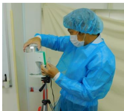
<浮遊菌検査を行う様子>