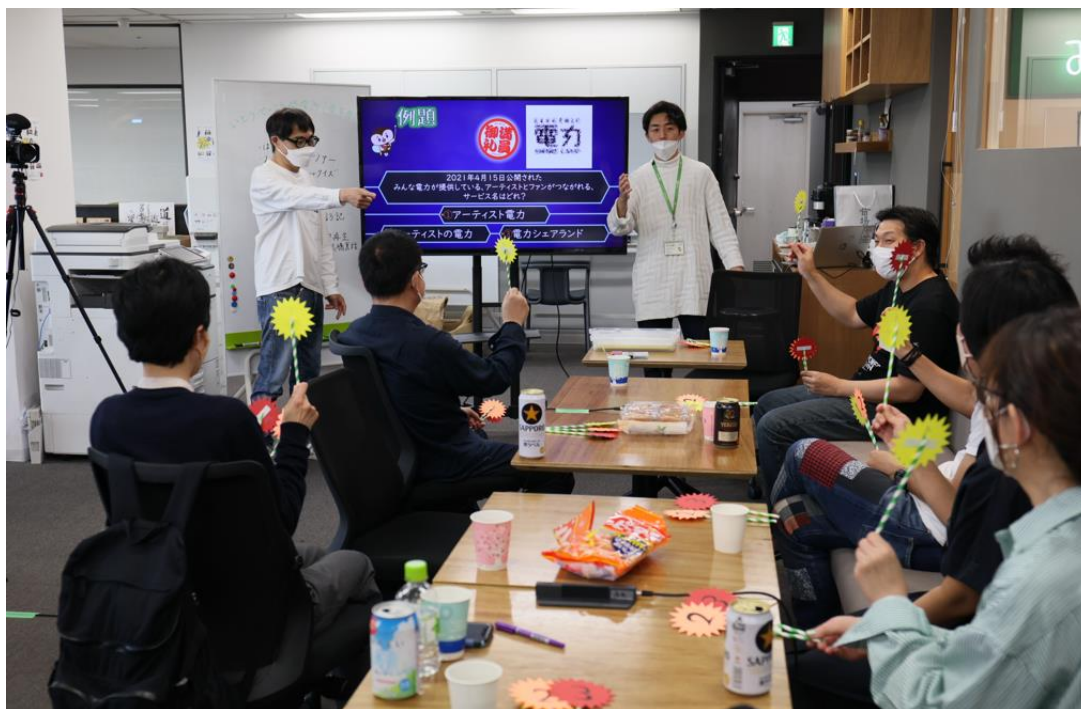
いとうせいこう発電所 1周年記念イベントの様子

<ご参考> いとうせいこう発電所 取り組み詳細 https://minden.co.jp/blog/2021/09/15/4745