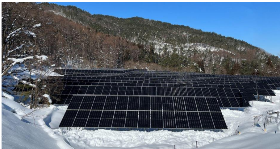
コーポレートPPAに活用する長野県田上市の太陽光発電所（発電事業者：スマートブルー株式会社）

コーポレートPPAは、需要家と発電事業者の間で長期間の電力買取契約を結ぶことで新規の再エネ発電所の開発を進めるスキームです。再エネの普及につながるとともに、需要家は卸電力市場価格に影響されない固定価格で再エネ電力を長期安定的に調達できます。